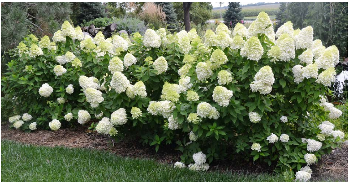
Hydrangea paniculata 'Limelight' / hortenzie