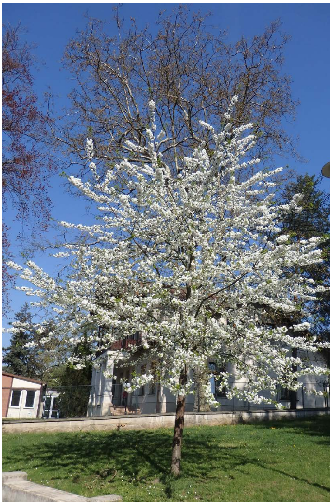
Prunus avium 'Plena' / plnokvětá třešeň, neplodná