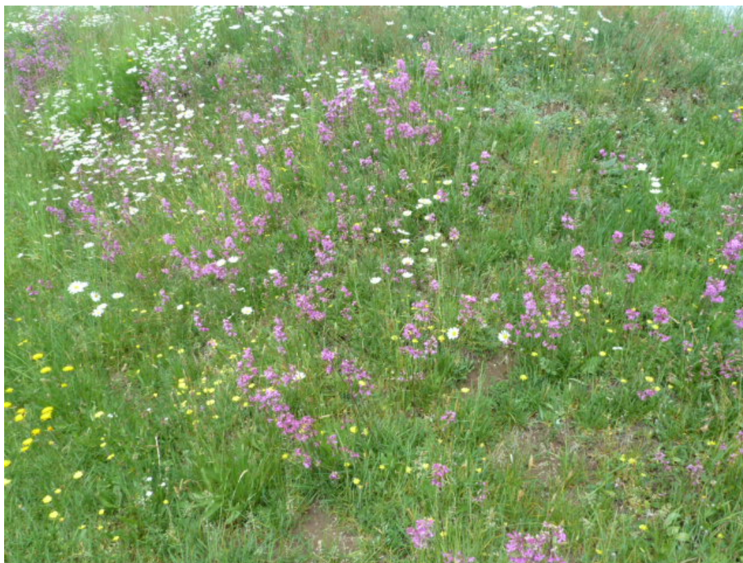
Suchá nízká loučka na svahu