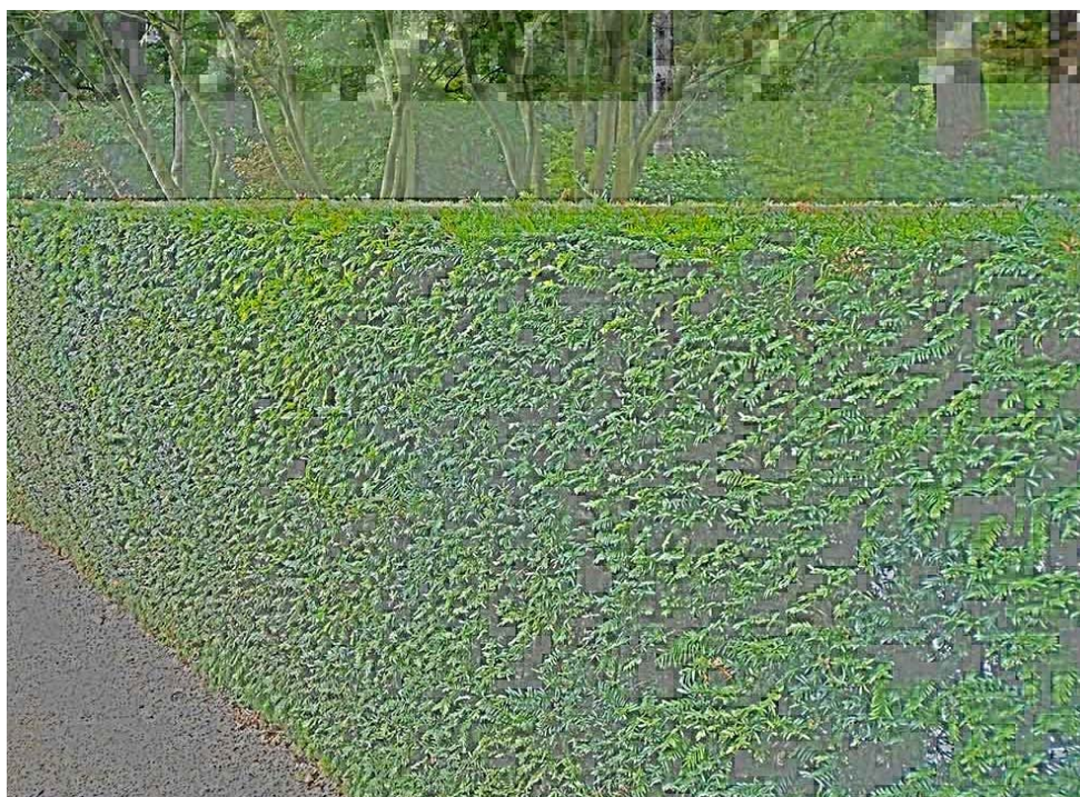
Taxus baccata / tisová linie