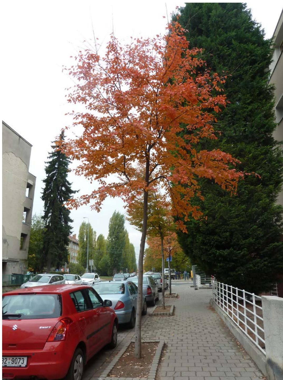
Amelanchier arborea 'Robin Hill' / stromový typ muchovníku