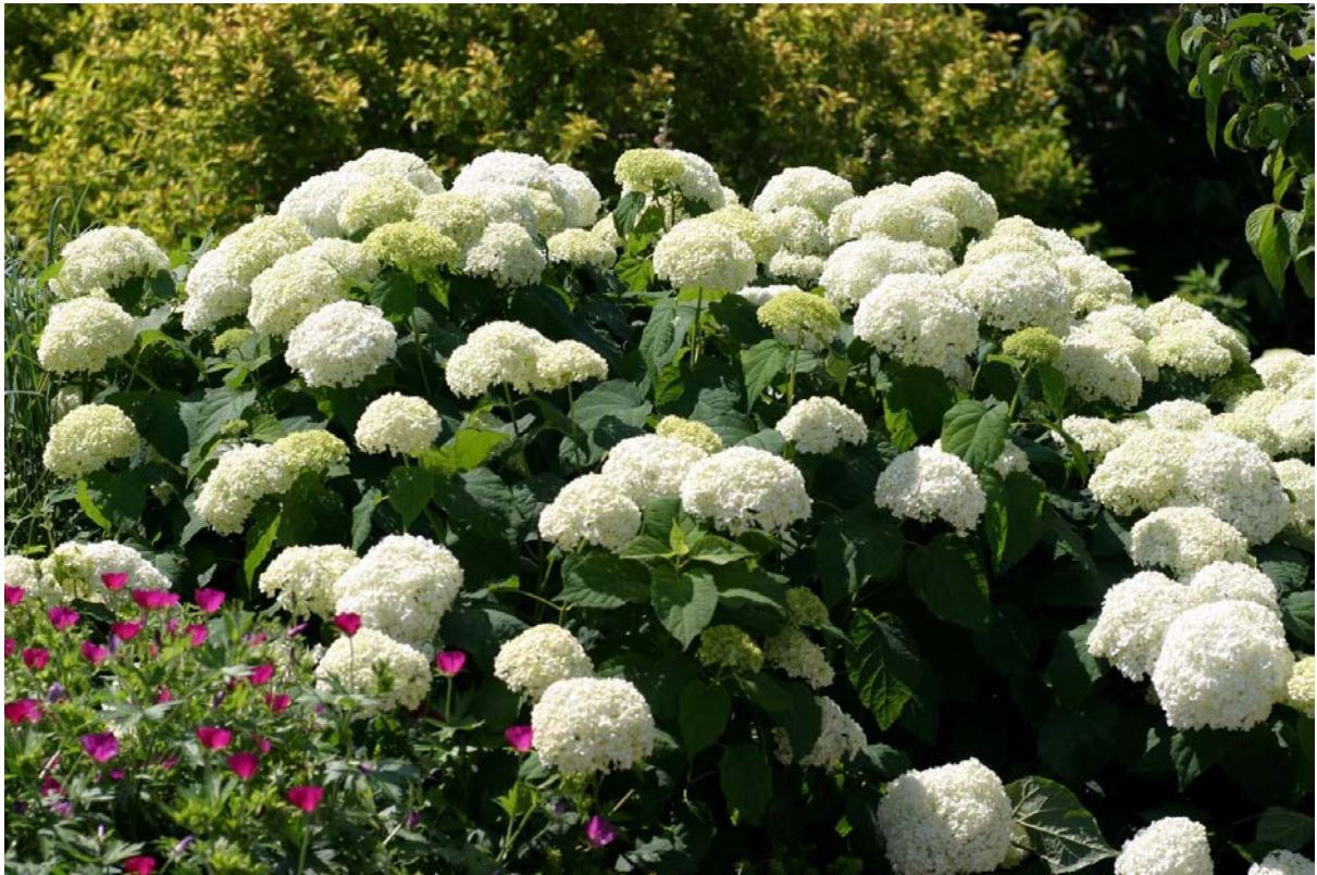
Hydrangea arborescens 'Annabelle Strong' / hortenzie