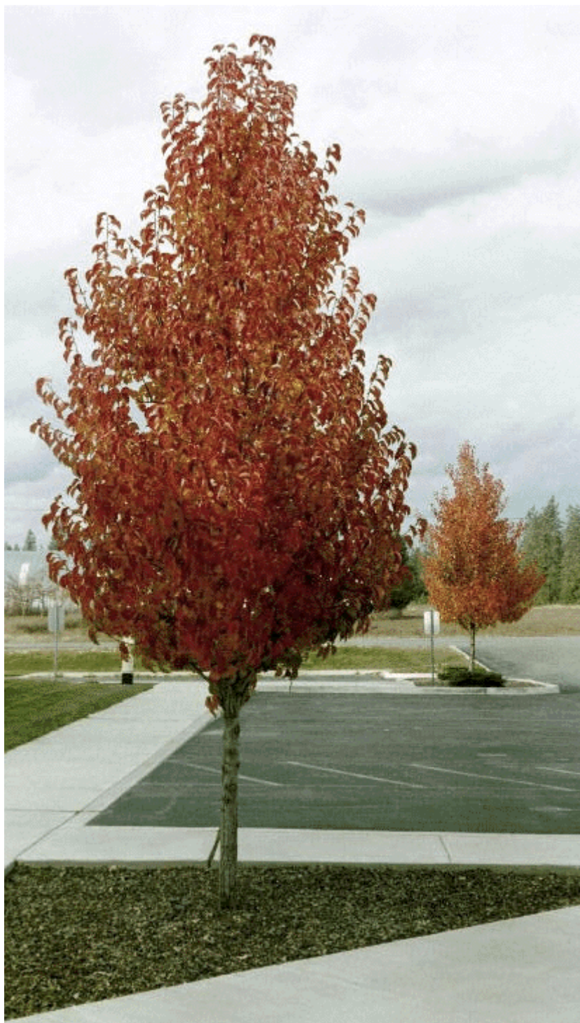
Pyrus calleryana 'Chanticleer', okrasný typ hrušně s miniaturními tuhými plody