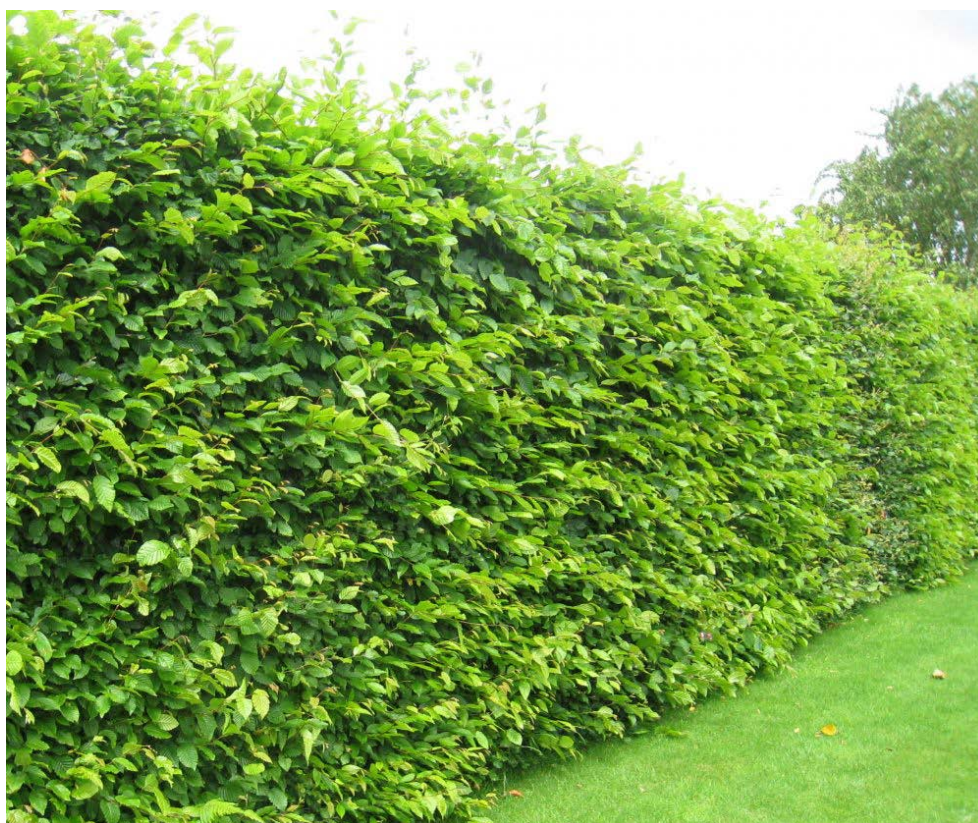
Carpinus betulus / habrová linie