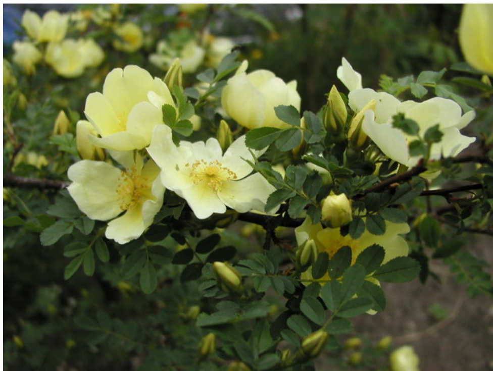
Rosa hugonis / žlutokvětá botanická růže