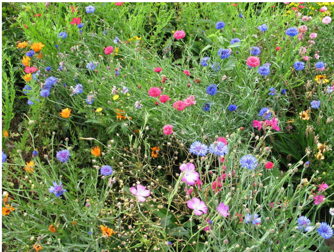
Květnatá louka s podílem letniček