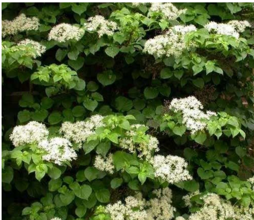
Hydrangea petiolaris / pnoucí hortenzie