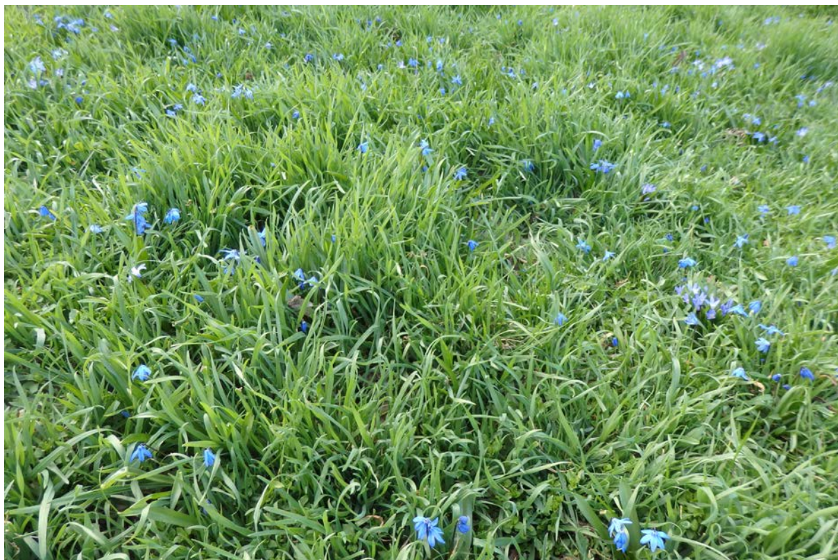
Scilla sibirica / ladočka , vysazená do trávníku