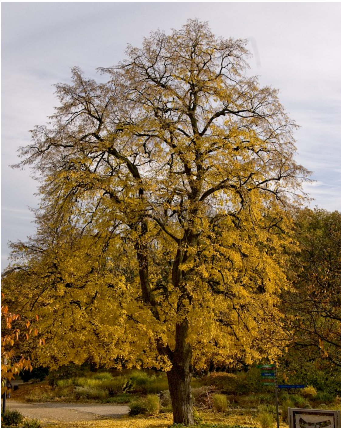
Tilia euchlora / lípa evropská/